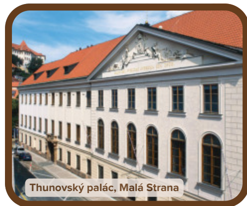
Thunovský palác, Malá Strana